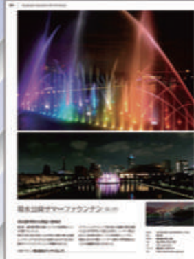
▲富山県 環水公園サマーファウンテン