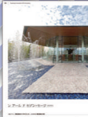
▲長野県 レアールド セゾン・セージ