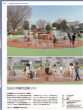
▲群馬県 もみじ平総合公園