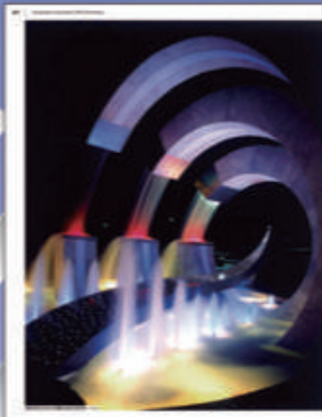
▲徳島県 あつま総合運動公園

このたび45周年記念事業の一つとして、過去から現在に至るまでの私共の作品の一端を、こうして一つの冊子として皆様のお目に触れる機会を得たことは誠に喜ばしい限りです。本冊子にご紹介出来た水景は、45年の歴史の中のほんの一コマでもあります。ぜひ手に取ってご覧頂けたら幸いです。