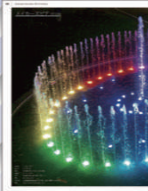
▲愛知県 メイカースピア