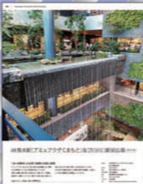
▲熊本県 JR熊本駅(アミュプラザくまもと)及び白川口駅前広場